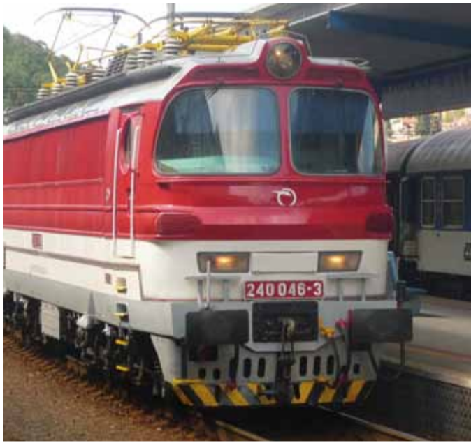
LAMINÁTKA. ZSSK má ve svém parku řadu lokomotiv vyrobených v plzeňské Škodovce.

mezi ZSSK (dodavatel) a státem (odběratel). Loni klesla úhrada státní objednávky o 400 mil. Sk na 5 mld. Sk, což reprezentuje úhradu téměř 160 Sk (cca 127 Kč) na vlakový kilometr.