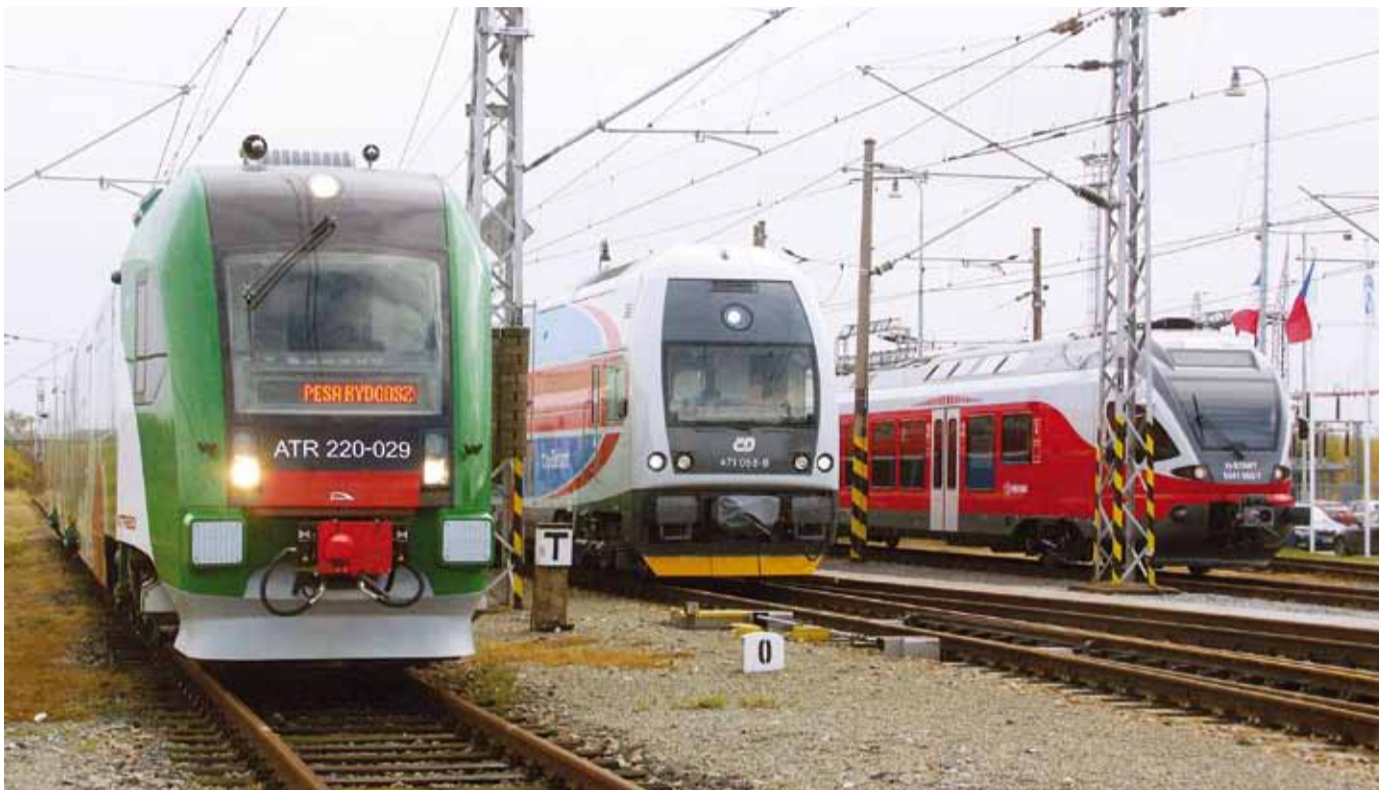
NABÍDKA PRO REGIONY. Při prezentačních jízdách ve Velimi výrobci ukázali, jaké vozové jednotky mohou nabídnout. České dráhy si z nich budou vybírat v rámci projektů, na které přispěje také Evropská unie.

Speciální nabídku pro mladé do 26 let připravily České dráhy na 16. a 17. listopadu. Od pondělí 9. listopadu se na tyto dva dny prostřednictvím eShopu prodávají zpáteční ČD Tipy z Prahy do Vídně za 15 eur, z Brna do Vídně za 8 eur a z Ostravy do Vídně za 15 eur. České dráhy tímto způsobem připomínají 20. výročí tzv. sametové revoluce. (tis)