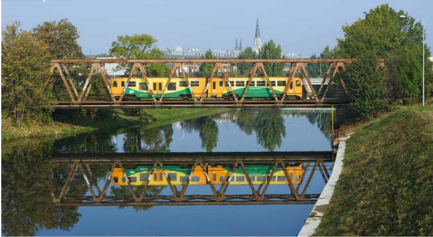
OLOMOUC. Na mostě přes řeku Moravu. Zasílejte vaše fotografie s železniční tematikou a nezapomeňte na sebe uvést kontakt, rodné číslo a číslo bankovního účtu. Každá zveřejněná fotka se stává výherní. Jako cenu získáte částku 500 korun. Podmínky soutěže najdete na www.ceskedrahy.cz/zeleznicar .