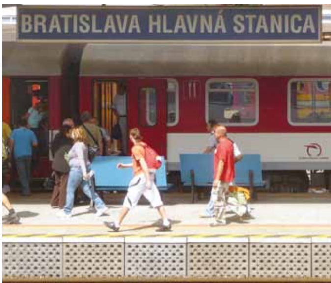
HLAVNÁ STANICA. Vstupní branou do slovenského hlavního města projdou denně tisíce cestujících.

ZSSK jako národní železniční dopravce zajišťuje přepravní služby na základě Smlouvy o výkonech ve veřejném zájmu uzavřené podle ustanovení zákona o drahách