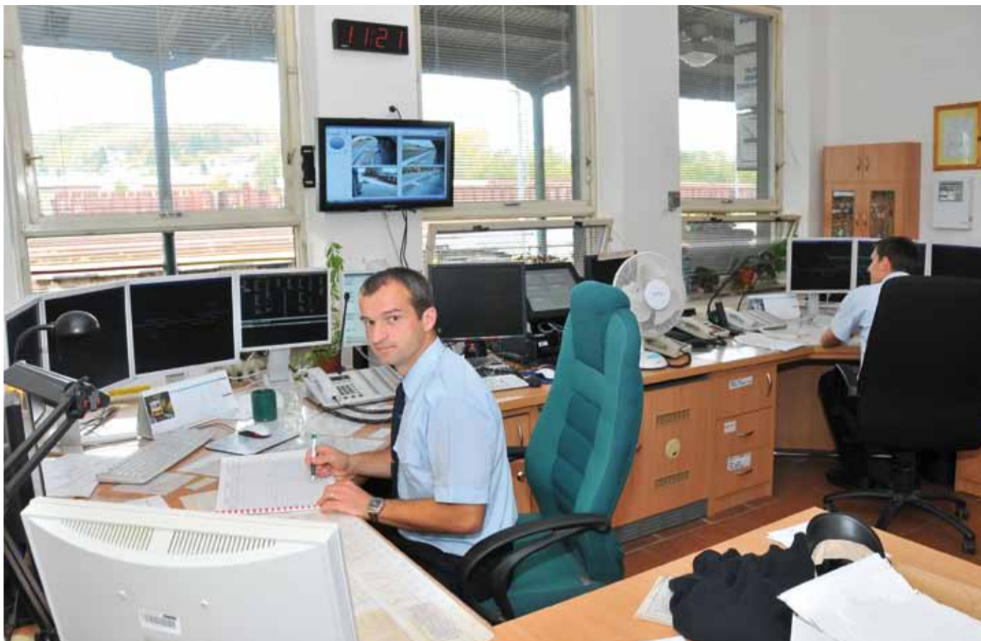
DISPEČINK. V Krnově dnes řídí trať pomocí počítačů, které jsou uschovány v bezprašném a klimatizovaném prostředí.