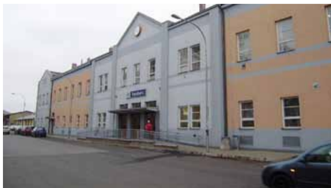
DNES. A v této podobě ji můžete vidět nyní.