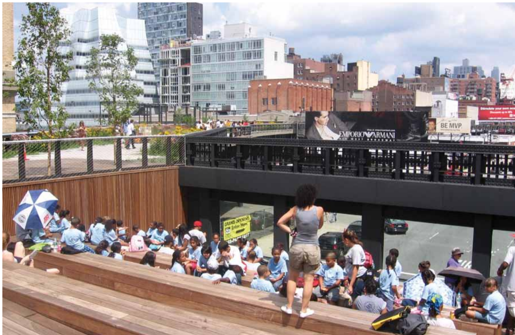
NAD ULICÍ. V zastavěném velkoměstském prostoru je nutno vytvářet klidové zóny i přímo nad rušnými třídami.