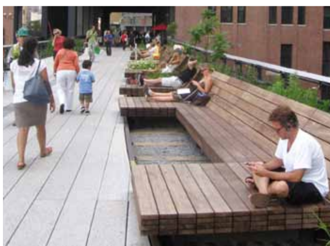
RELAX. Dřevěné lavice, které jsou postaveny přímo na kolejích, lákají k oddechu tisíce návštěvníků.

Původní trať vznikla v třicátých letech minulého století jako mostní konstrukce ve výšce deseti metrů nad ulicemi, aby nákladní vlaky směřující do průmyslové části Manhattanu neohrožovaly obyvatele centra města. „V druhé polovině devatenáctého století, kdy vedly