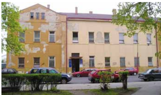
KDYSI. Takhle vypadala nádražní budova ještě před pár lety.

Samotná železniční stanice je důležitým přestupním uzlem, ze kterého ČD zajišťují železniční propojení celého regionu. Vzhled postupně stárnoucího nádraží se zásadně změnil v roce 2006, kdy byla provedena rekonstrukce střechy, fasády a peron-