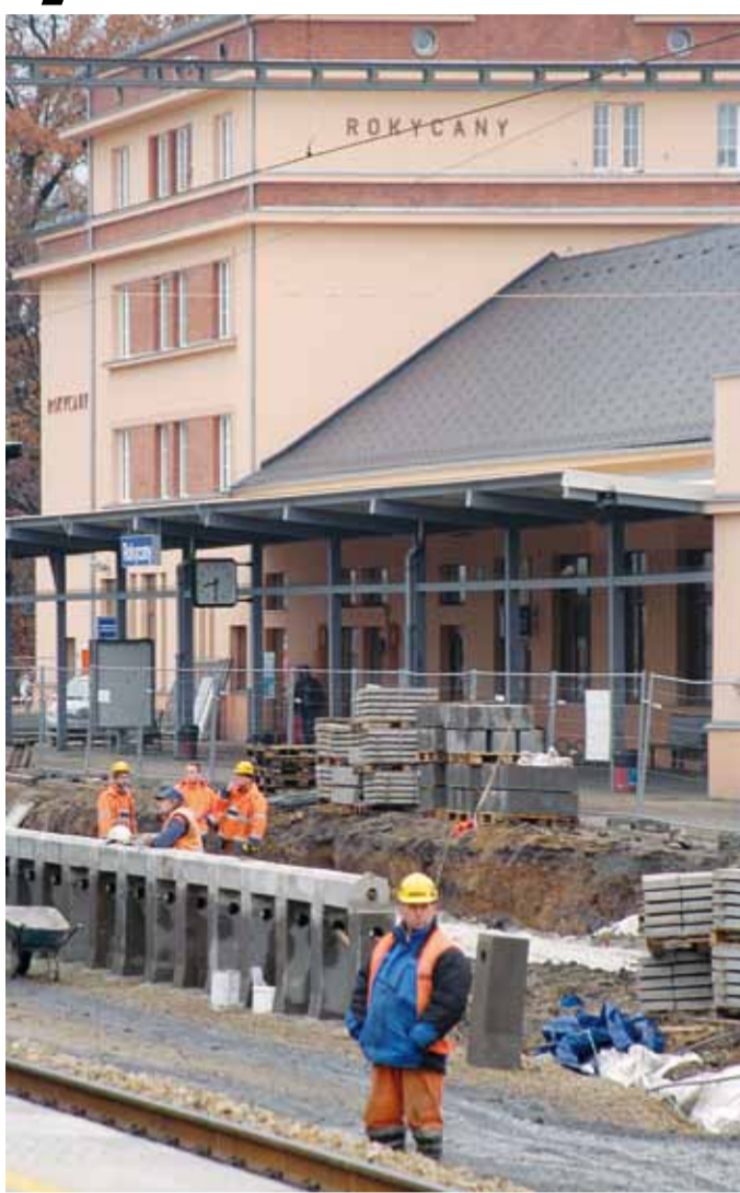
V PLNĚM PROUDU. V Rokycanech ještě letos dokončí všechna nástupiště pro cestující.

Součástí stavby jsou také modernizace sdělovacího a zabezpečovacího zařízení, rozsáhlé úpravy elektrizace tratového úseku