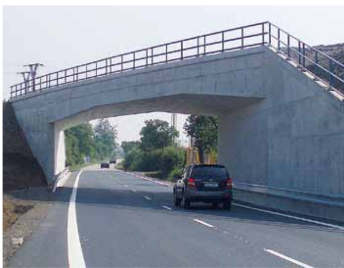
MIMO OHROŽENÍ. Bezpečnost cestujících ve vlacích již nebudou ohrožovat ani vysoké nákladní automobily.

Most z roku 1940 se nachází na odbočné trati z koridoru Břeclav – Přerov a převádí ji přes silniční komunikaci II. třídy mezi Starým Městem a Moravským Pískem, která je souběžná s koridorovou tratí. Vzhledem k tomuto uspořádání dochází ke křížení silnice a tratě pod úhlem 25°. Původní železobetonová nosná konstrukce mostu s tuhou výztuží ze zabetonovaných nosníků byla uložena na spodní stavbě pouze prostřednictvím kluzných ocelových plechů a lepenkových vrstev. Vlastní nosnou konstrukci tvořila velmi šikmá ocelobetonová deska se zabetonovanými ocelovými nosníky proměnné výšky stěny.